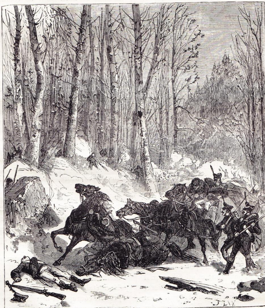
CAMPAGNE DE FRANCE. — Corps francs attaquant un convoi ennemi.

Les coalisés avaient fait précéder leur marche de la déclaration de Franc-