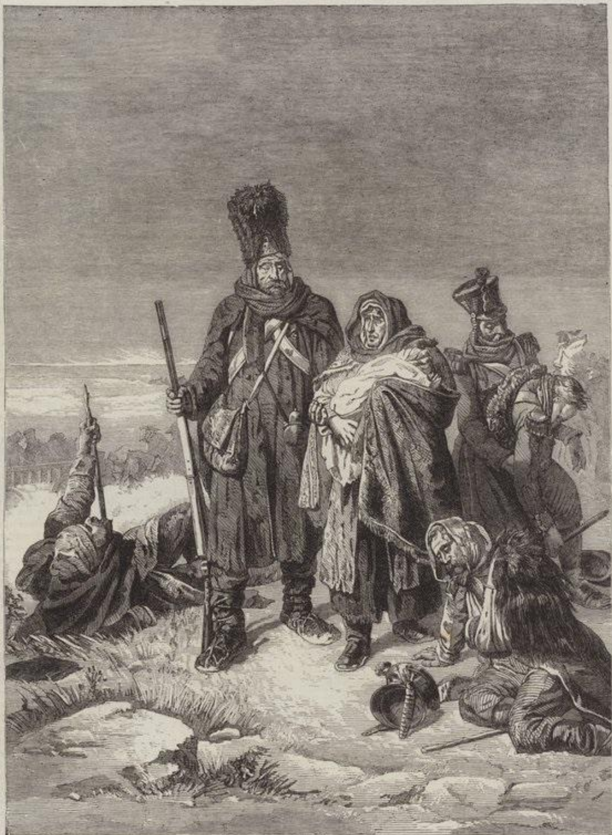
"AN EPISODE OF THE RETREAT FROM MOSCOW," BY M. HIPPOLYTE BELLANGÉ, FROM THE PARIS EXHIBITION OF FINE ARTS, 18 53.